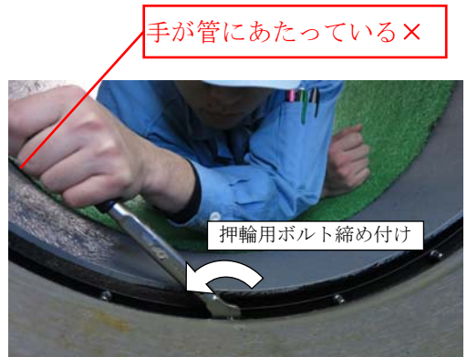
写真1 不適切な締め付けトルク確認方法例

PN形の接合作業の中で、呼び径700以上は、「押輪用ボルトのねじ出し」があります。ここで、ねじの標準締め付けトルクは、 10N・m と定められています。このとき、写真1に示すように手が管にあたった状態でトルクレンチを締め付けると、所定のトルクを確保できません。