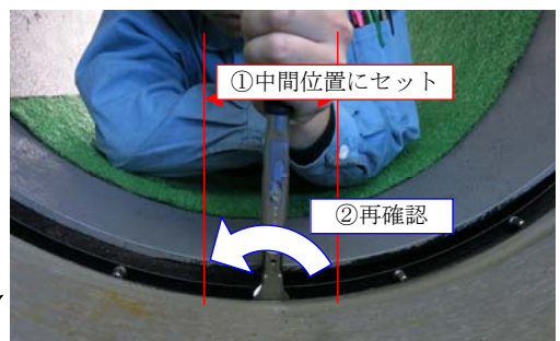
写真2 推奨する締め付けトルクの確認方法