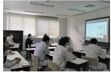
会津若松市上下水道局聴講状況