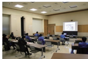
札幌市水道局聴講状況