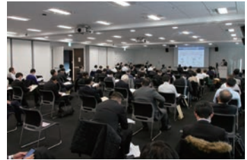
大阪会場聴講状況