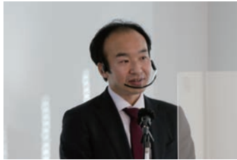
宮城県企業局 岩崎技監兼次長