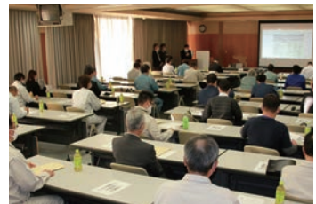
松山会場聴講状況