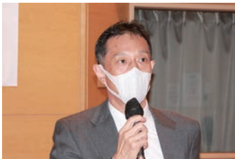
厚生労働省 熊谷水道課長