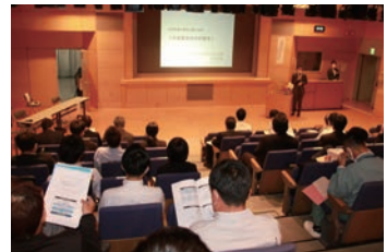
広島会場聴講状況