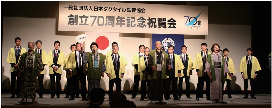
披露された鉄管甚句