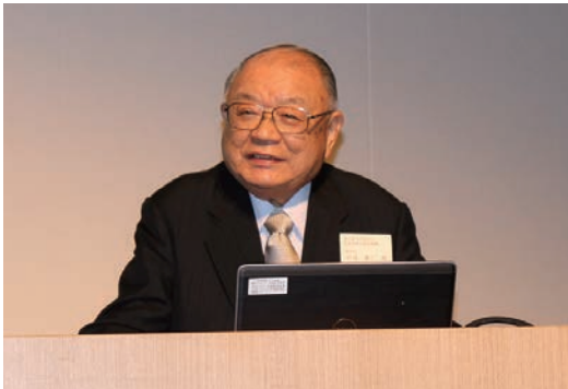
丹保北海道立総合研究機構理事長

引き続き行われた祝賀会のオープニングセレモニーでは、アンサンブルカノンの皆さんの優しい音色が来場者を会場にいざないました。